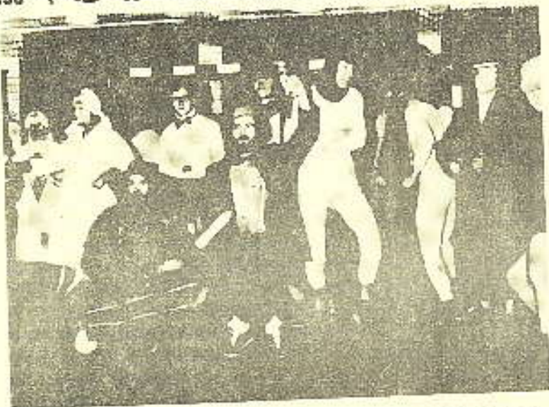
LÆRERNES LAG FRA HØYRE MOT VENSTE