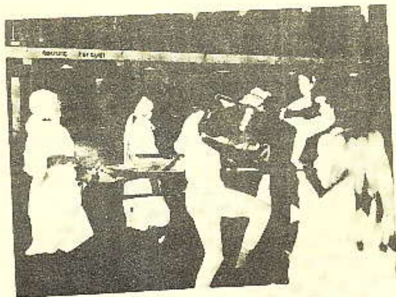
LÆGETEAM HØRER MED