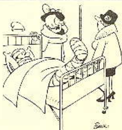
Dommeren ventet på ham — utenfor fotballbanen!

Her, beretter garten stult. — ser du en kar som står for en stund. Men mamma og postbudet var nedt til å gå og legge seg!